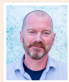
Regio Zuid Leo Korbijn