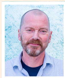
Regio Zuid Leo Korbijn