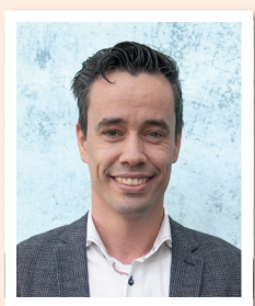
Regio Zuid Hermen Groothedde

Wil je een rondleiding door de digitale leeromgeving van Knowhow | Office en Management? Of heb je advies nodig over de boekenlijst? Wij helpen je graag verder!