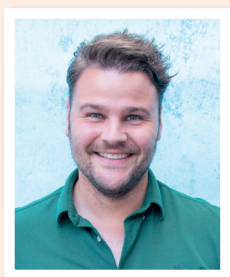
Regio Midden Robbert Diender